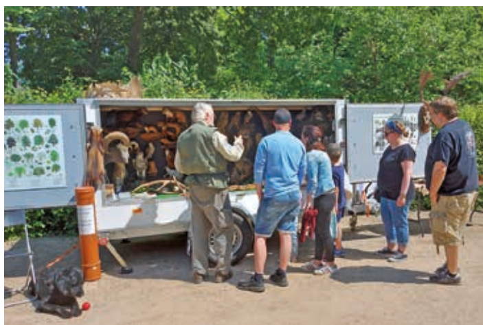
SDW-Waldmobil im Einsatz

sie jeden Tag regelmäßig Nahrung erhalten. Die Vorstände: „Wir haben an den Zäunen Ratschläge zum richtigen Füttern angebracht. Die sollten die Besucher unbedingt beachten.“