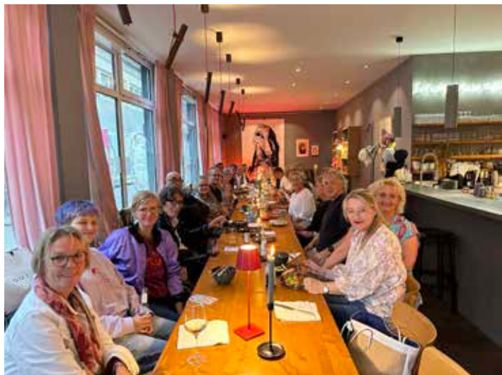
Netzwerktreffen der beteiligten Geschäftsleute und Kunstschaffenden im ‚Fräuleinswunder‘