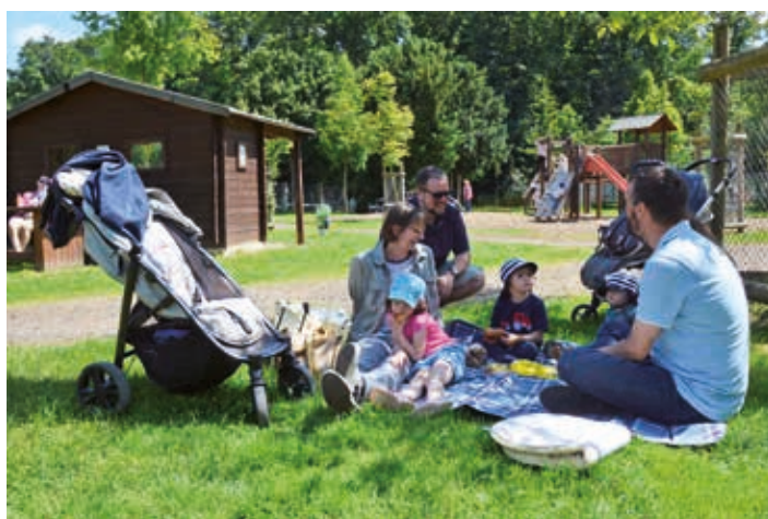
Pause auf dem Spielplatz