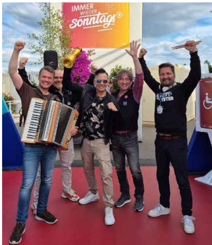
Das Königlich Bayrische Vollgas Orchester

Weitere TV-Termine mit dem Königlich Bayrischen Vollgas Orchester: 05.07. BR Abendschau und 08.07. ZDF-Morgenmagazin in Berlin